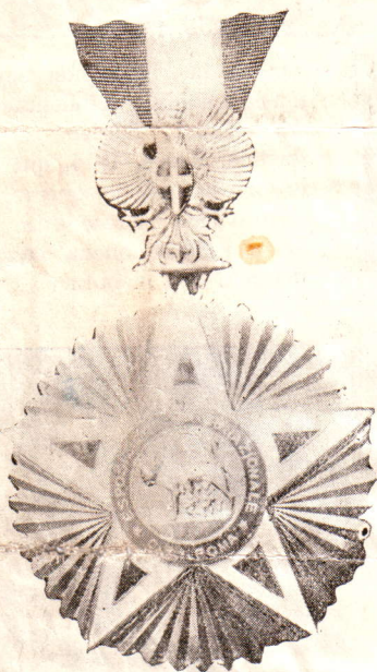
La gran cruz